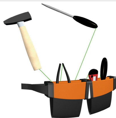
Modell des Werkzeuggürtels mit integrierter Rückholeinrichtung

Von Schraubendrehern und Zangen über Hämmer und Schraubenschlüssel – alle Arten von Werkzeugen lassen sich an der neuartigen Werkzeutasche befestigen. Der Werkzeuggürtel kann in einem breiten Design- und Materialspektrum gefertigt werden und ist vielseitig einsetzbar.